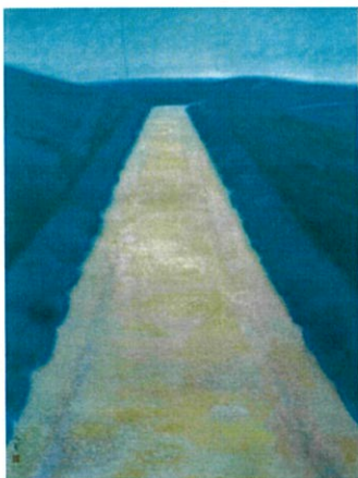
(問 9) 《道》