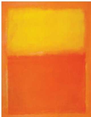
(問 24) 《オレンジと黄色》