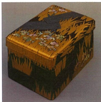
(問 10) 《八橋蒔絵硯箱》