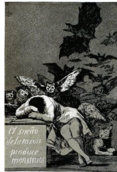
(問 20) 「理性の眠りは怪物を生む」 (『ロス・カプリーチョス』より)