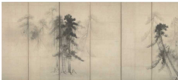
(六曲一双のうち右隻)